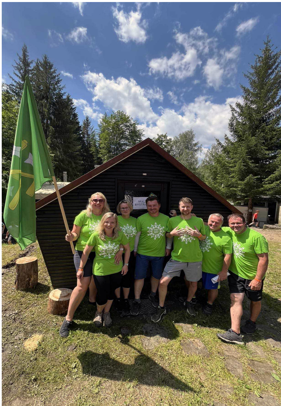
↑ Tým naší obce během soutěže Hry bez hranic.